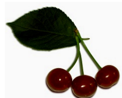
Arômes de cerises noires