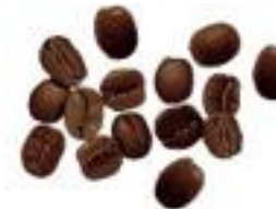
Arômes de moka